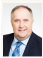
Monsieur Paul Busque Député de Beauce-Sud

Téléphone : 418 387-2044 / Télécopieur : 418 387-4250 aspenard-beno@assnat.qc.ca