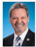
Monsieur André Spénard Député de Beauce-Nord

Téléphone : 418 234-1893 / Télécopieur : 418 234-1659 Téléphone sans frais : 1 866 774-1893 nmorin-cds@assnat.qc.ca